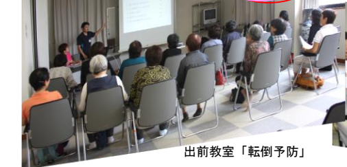
出前教室「転倒予防」