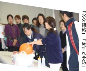
「水分補給」 「床ずれ予防」