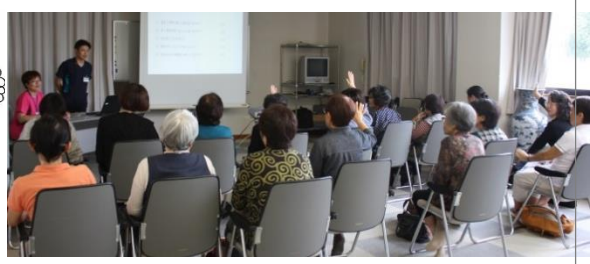
▲転倒について（にっこり会） ▼水分摂取について（介護者の会）