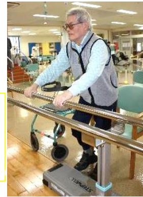
リズムに合わせて楽しくステップリハ

福岡大学教授、田中博明先生が 考案された運動方法で、主に 下肢筋力向上 心肺機能向上 認知能力の機能回復 に効果があると検証されています