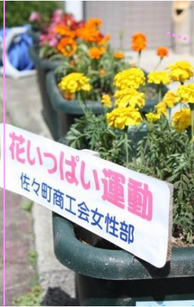
佐々町商工会女性部の皆様 いつもありがとうございます

町を花でいっぱいにして活動されている「佐々町商工会女性部」の皆様が来訪され定期的にプランターの花の植え替えをいただいています。当施設ではおもてなしの気持ちと季節感を大切にするために花をあちこち飾って楽しんで頂いています。通所利用者さんやご家族、また職員も思い思いに庭先などから花を届けてくれ、明るい雰囲気生まれています。ホント感謝です。