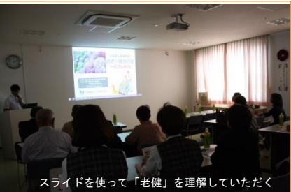
スライドを使って「老健」を理解していただく

老健の役割や特別養護老人ホームとの違いを知らないという方は沢山いらっしゃいます。私たちは、老健が「社会資源の一つとしてその「機能と役割」を知って頂くことも大切な仕事だと考えています。当施設では各種団体等を対象に視察研修や出前講座を開催しています。キラメキを上手に使うために、どうぞお気軽にご連絡ください。少人数でも承っています。