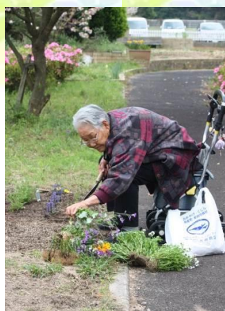
お花好きが伝わります。ありがとうございます

物を持って腕を返すことができない、指の細かい動きが難しい、握る力が弱い方に適した自助具です。先の角度が自由に曲げられる物もあります。