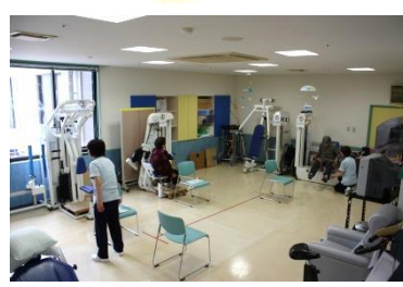
個人ごとのプログラムに沿ってメニューをこなす。意欲がそのまま効果に表れる。