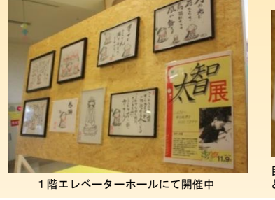
1階エレベーターホールにて開催中