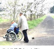
牧山施設長もひと押し

日本の花、桜が今年も見事に花を咲かせ皆さんの目を楽しませてくれました。通所リハビリのバスを春がすみと、風に舞う花びらが包んでくれ、送迎も楽しい時間に。もちろんお出かけもお楽しみ。「あなたのために今年も咲きました」そんな声が聞こえそうな柔らかな花たちに感謝です。