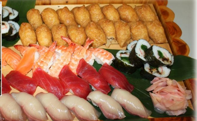
<美味しいお寿司を握ってくれた会社：(株)富士産業>