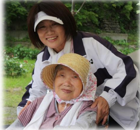
ご家族様満足度アンケートより