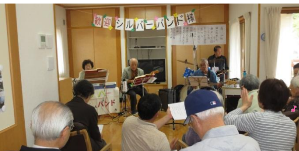
ドリームケア吉井での楽しい演奏会