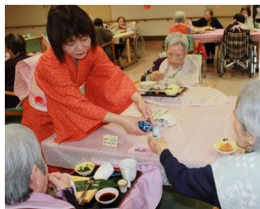
おひつじの メロディ

ひな祭りの日は毎年お寿司を楽しく美味しくいただけてもらっています。色も鮮やかなお寿司が食欲をそそります。今回も着姿のスタッフの色を添えてくれ甘酒をふるまい、華やかな雰囲気になりました。目の前で職人さんが握ってくれ、ついつい食べ過ぎてしまった人もいたのでは。