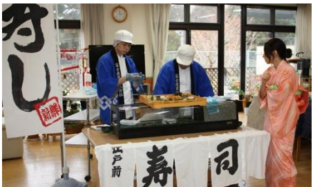
人気の実演コーナー

ひな祭りの日は毎年お寿司を楽しく美味しくいただけてもらっています。色も鮮やかなお寿司が食欲をそそります。今回も着姿のスタッフの色を添えてくれ甘酒をふるまい、華やかな雰囲気になりました。目の前で職人さんが握ってくれ、ついつい食べ過ぎてしまった人もいたのでは。