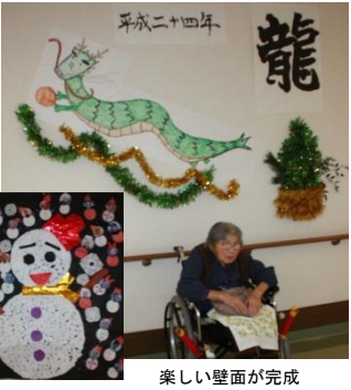
「ドリームケアさざ」の皆さんによる龍の力作をバックに新春の陽を浴びるさざ・煌きの里

今年は辰年。天高く昇り龍の勢いのでいい一年にしたいですね。今年も書家スタッフによる迫力いっぱいの大書が完成(写真右)し堂々と掛けられています。フロアにはちょっと可愛い龍が天空に駆け上がり、雪だるまの上に笑顔の雪が降りしきる飾りもできあがりました。今年もいっぱい笑顔が降りそそぐさざ・煌きの里でありたいものです。