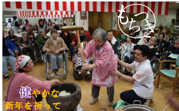
健やかな新年を祈って