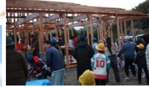
開設準備室: さざ・煌きの里 <担当> 堤・葉玉寺