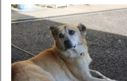
↑ いやしんぼキラ ← 少し年取ったヒカル