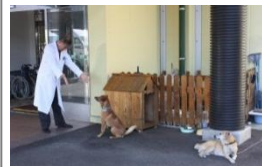
施設長さんがやってきた。ちょっと相手してやるか。

の顔を見るだけでその日の調子がわかります。これも僕たちの臭覚のなせる技でしょうか。リハビリで足がすいぶんしっかりなられたなあとか、明るい顔になられたなあとか。僕たちも皆さんの元気な顔を見るのが楽しみなんです。「おはよう!」って皆さんの元気な声を次の朝も聞きたいから、皆さんを送った後、2匹で「明日も頑張ろうね」って言ってます。